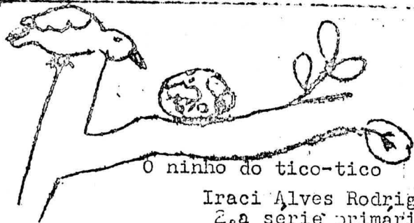
O ninho do tico-tico

Devemos amá-las com carinho e desvelo, não cortando essas árvores que são de grande utilidade à humanidade; essas que o homem indo em busca de abrigo, encontra flores, frutos e sombra.