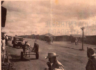
Candangos e carroça na Cidade Livre: o planalto sob olhar do português